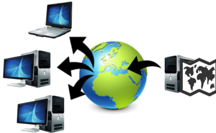
Abbildung 1: Schematische Darstellung der Kartenverwaltung

Die Kartenverwaltung ist in zwei Spalten gegliedert (siehe Abbildung 2 ). Auf der linken Seite werden all die Karten angezeigt, die am lokalen Computer registriert sind und auf der rechten Seite die Karten, die der Server bereitstellt. Neben dem Erhalten neuer Karten können bereits vorhandene Karten vom Computer entfernt oder aktualisiert werden. Wird eine Karte ausgewählt, so werden Karten-spezifische Informationen im unteren Bereich des Programms angezeigt und das Gebiet wird auf der Weltkarte zentriert.